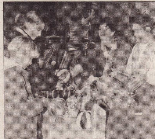
Pour Vie à Bousse, ce premier essai de marché de Noël a été un coup de maître.

Le premier marché de Noël organisé par l'association Vie à Bousse a obtenu un succès au delà des espérances des organisatrices. Tout au long de l'après-midi de dimanche, de nombreux amateurs ont défilé à la Salle Georges-Brassens pour admirer et acquérir des objets de décoration de Noël, rotin, tableaux en relief, et autres objets artisanaux disposés sur treize stands, dont sept tenus par des personnes extérieures à la localité.