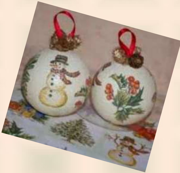
Boules de Noël