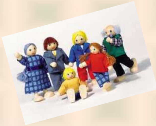
Poupées en tissu