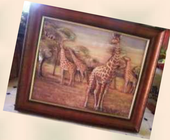
Tableau en relief

Plusieurs visites furent organisées : cristallerie de Portieux, achats à la ligne verte et chez Aude de Balmy , magasin d'usine s.e.b. etc..