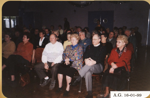
A.G. 16-01-99 V.C. 10-01-88

et ce jusqu'en 1999, date de la fin de cette activité. Entraînement des jeunes et adultes, initiation avec les écoles, partici- pation au championnat COJEP.