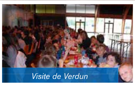
Visite de Verdun