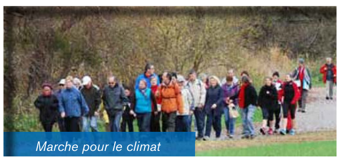
Marche pour le climat