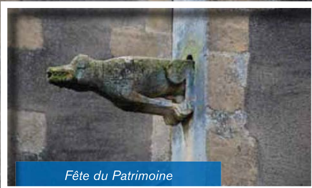
Fête du Patrimoine