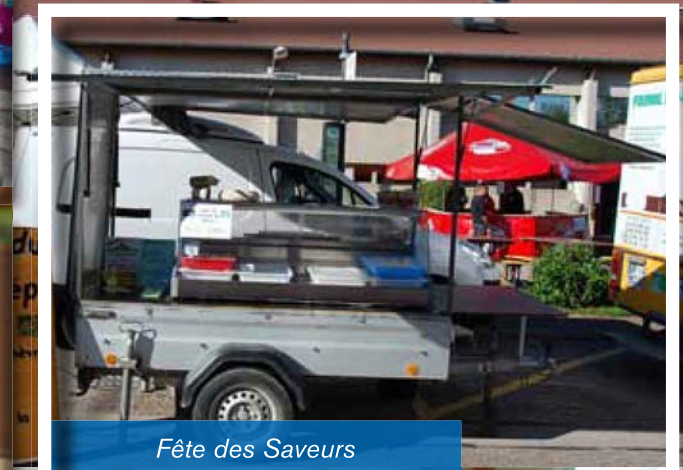
Fête des Saveurs